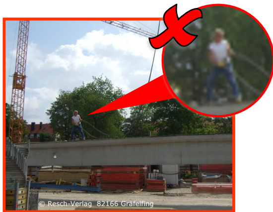
Das Nichttragen eines Helmes ist Fahrlässigkeit im Umgang mit der eigenen Sicherheit.

Der Schutzhelm ist der Sicherheitsgurt des Kopfes.