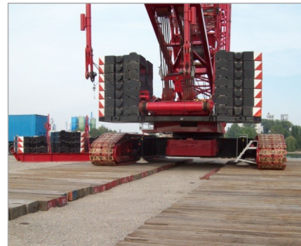
Schwerlastkran – ordnungsgemäß und breit unterbaut.