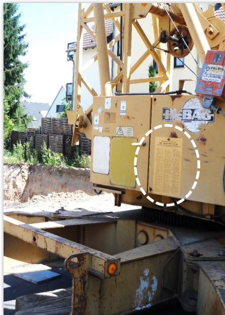
Abdruck der Pflichten und Betriebsvorschriften am Kran.

Für vorschriftsgemäßes Arbeiten hat der Kranführer Sorge zu tragen.